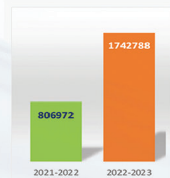
Super League Greece Προσέλευση Φιλάθλων

Πιο αναλυτικά και με βάση τα στοιχεία τα οποία συλλέχθηκαν από τις ΕΠΣ, πραγματοποιήθηκαν γύρω στους 40.000 αγώνες Ερασιτεχνικού Ποδοσφαίρου, όπως αποτυπώθηκε την αγωνιστική περίοδο 2018-2019.